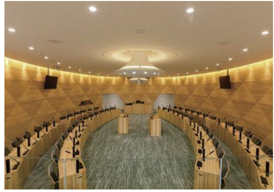
机・椅子を収納することで、多目的な利用が可能な議場